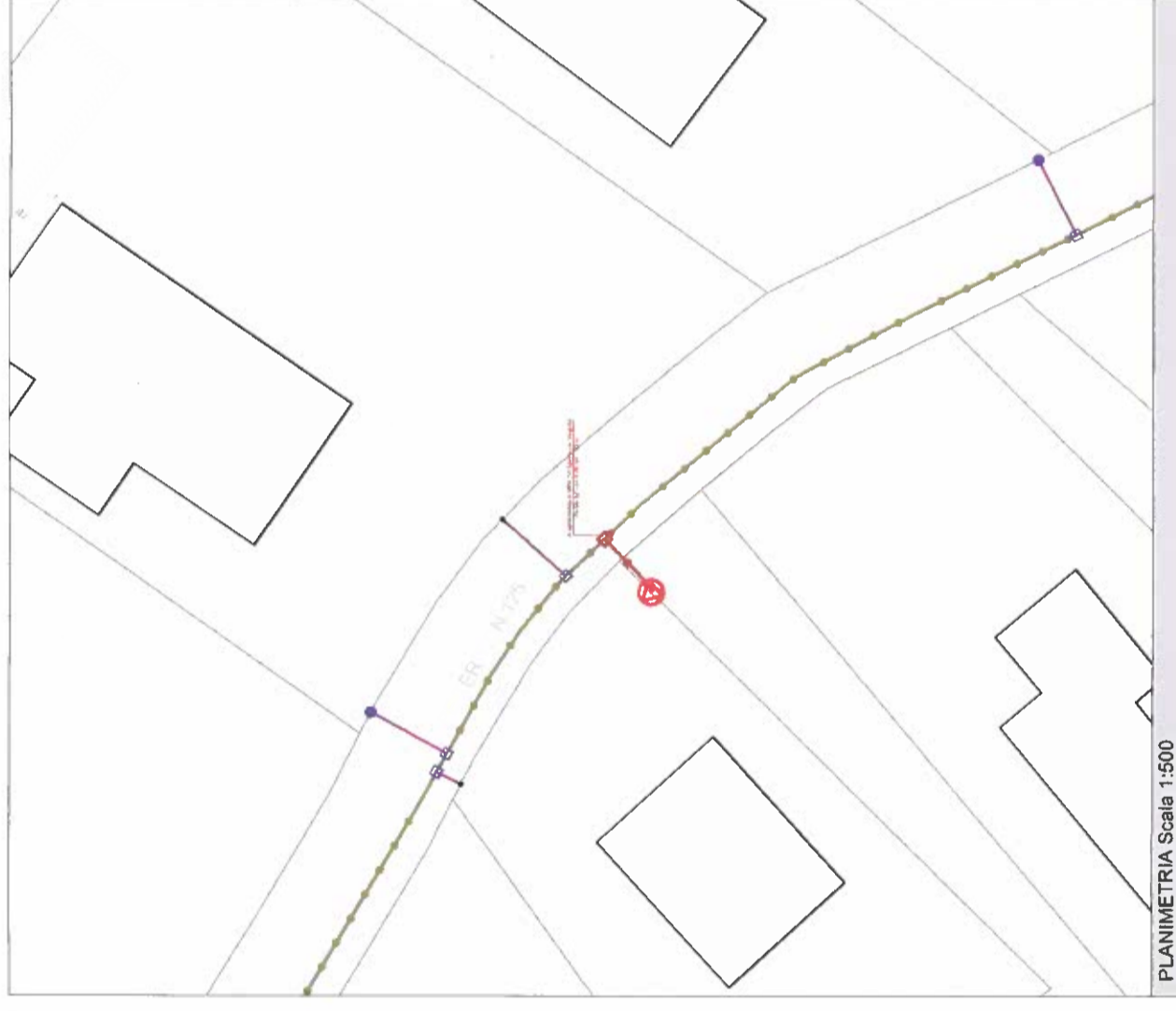
PLANIMETRIA Scala 1:500